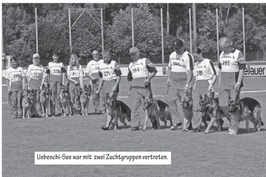
Uebeschi-See war mit zwei Zuchtgruppen vertreten.

Wir freuen uns alle auf die Hauptzuchtschau 2011 und hoffen auf eine höhere Beteiligungszahl, vor allem aus der Seite der Schweiz. ■