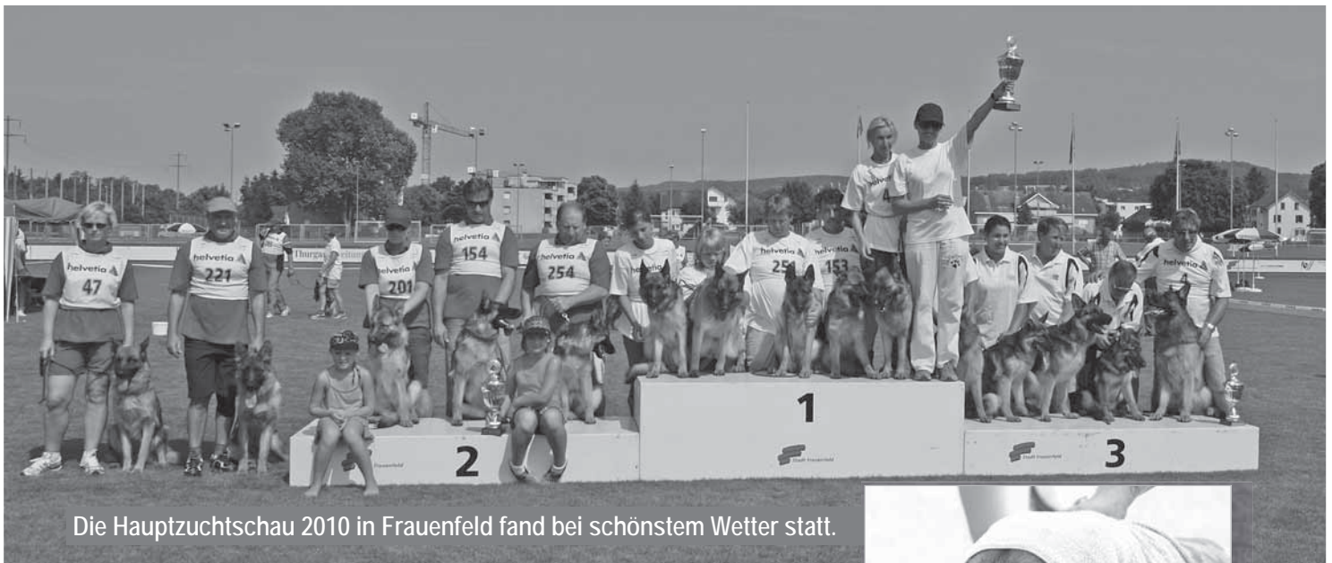
Die Hauptzuchtschau 2010 in Frauenfeld fand bei schönstem Wetter statt.